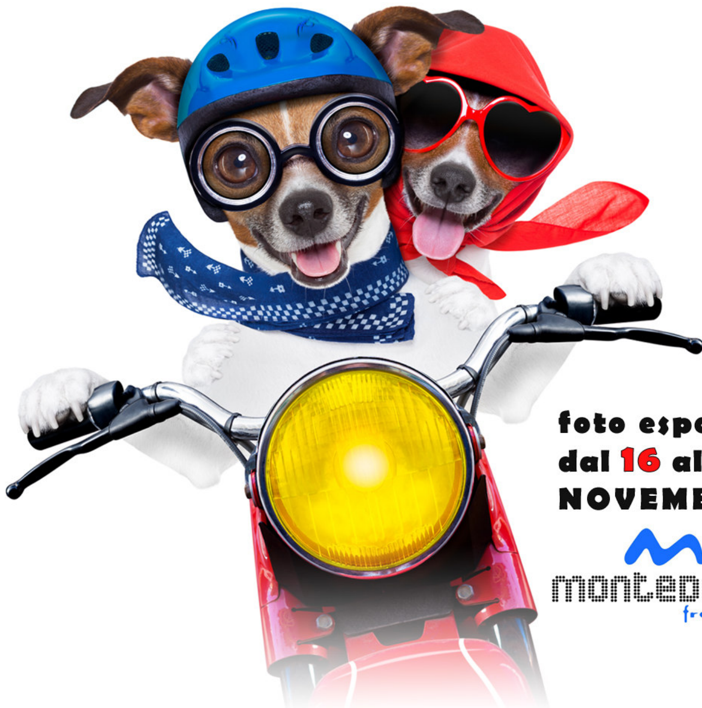
foto esposte dal 16 al 26 NOVEMBRE